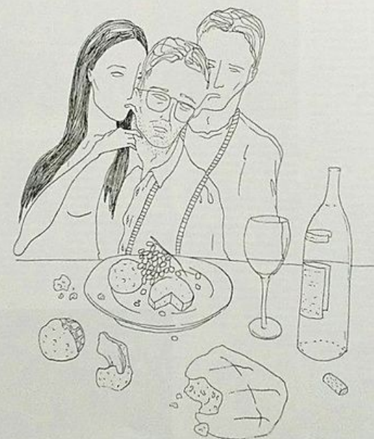
Illustrazione di Rajatka Lush

Premio Riccione "Pier Vittorio Tondelli", 11a edizione