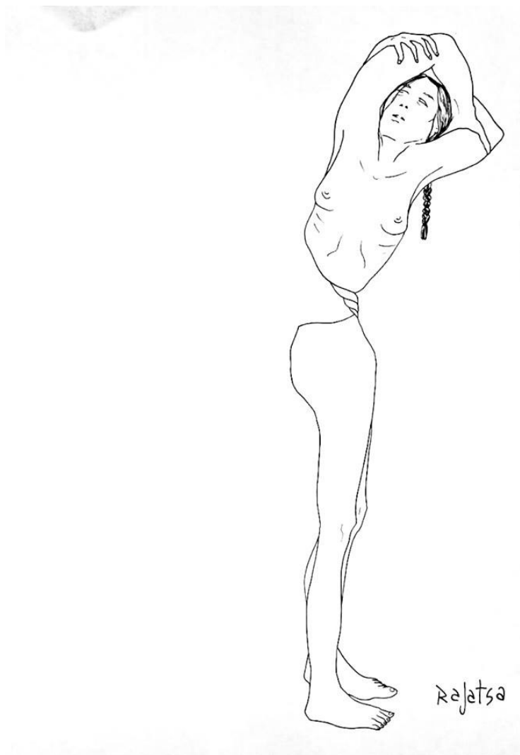
Illustrazione pubblicata sul catalogo della fondazione Circuiti Dinamici in occasione del concorso "I Luoghi del Silenzio" Milano 2016